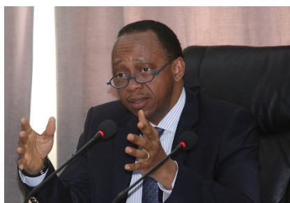
M. MAMADY YOULA, Premier Ministre, Chef du Gouvernement, République de Guinée

Ce début d'année a été marqué par la mise en place d'un Bureau d'Exécution Stratégique (BES) qui répond à la volonté du Premier Ministre Mamady Youla, Chef du Gouvernement, de transformer la Vision du Président, le Professeur Alpha Condé, en actions concrètes au bénéfice de l'économie guinéenne.